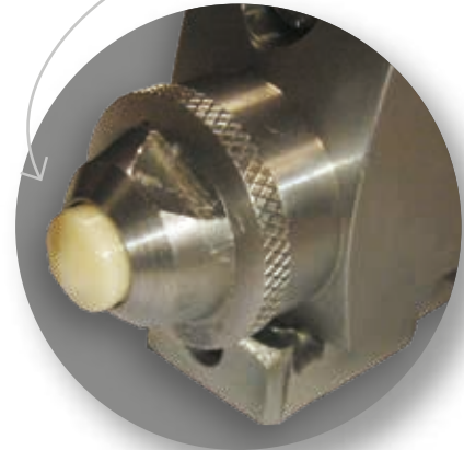
Boquilla cerámica de baja restricción