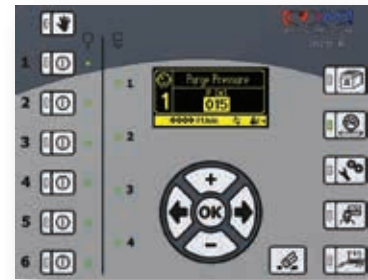
Modo de Purga