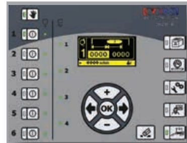
Patrón | Display