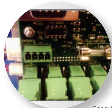
Conexión con encoder