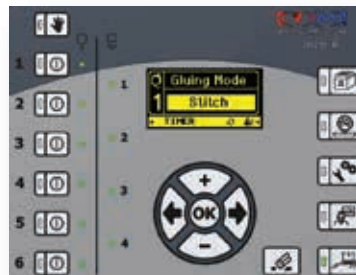
Modo por puntos