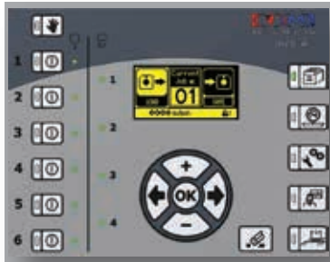
Almacenamiento de trabajos