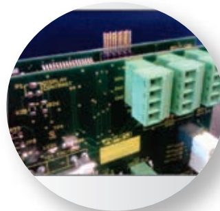
Conexiones de fotocélula