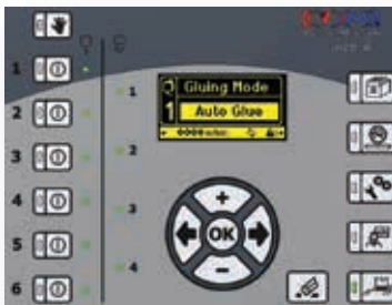
Auto Glue Modo