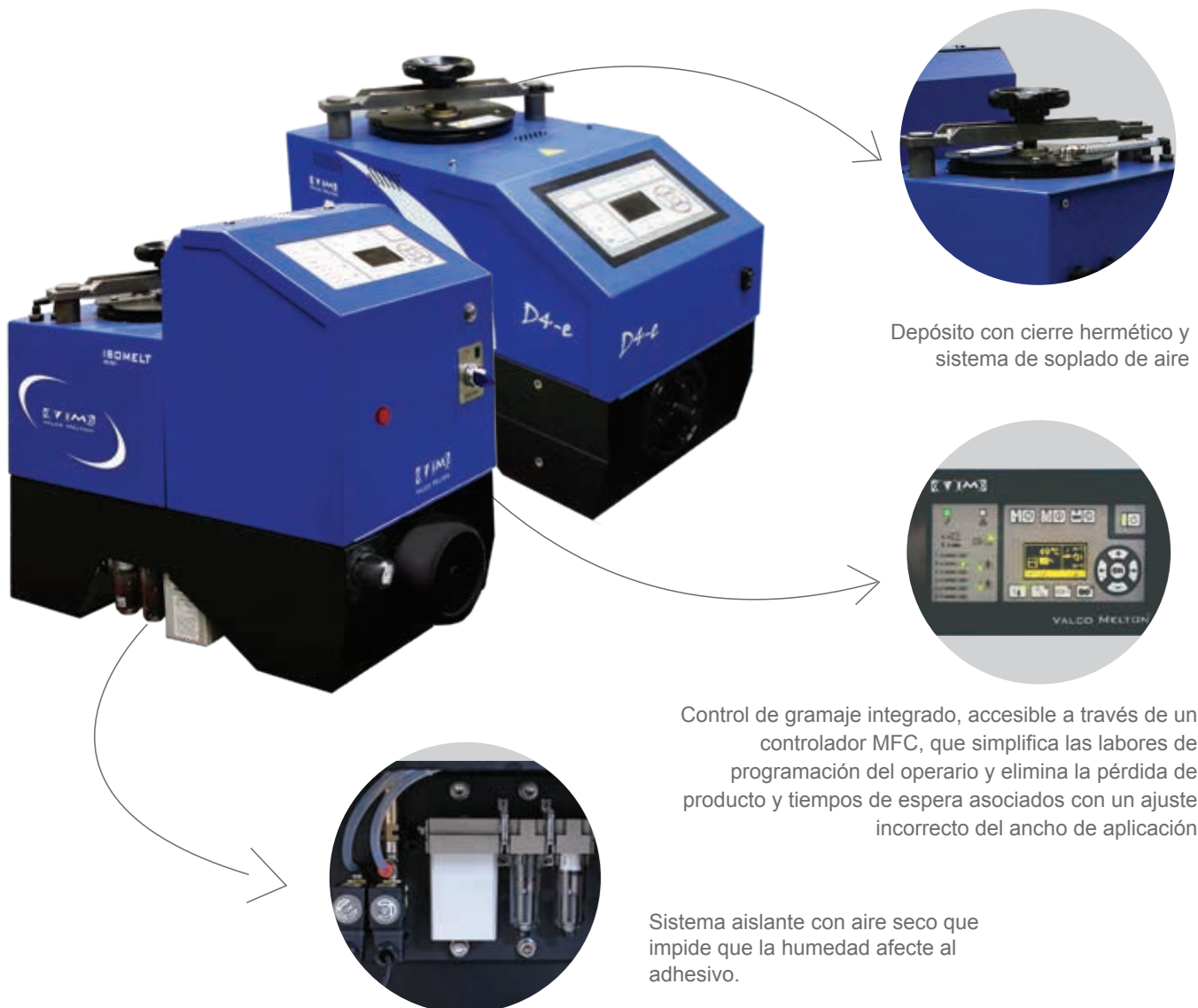
Depósito con cierre hermético y sistema de soplado de aire